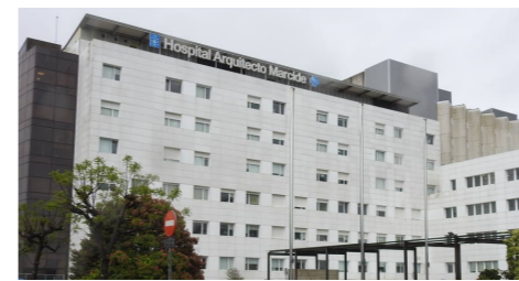
COMPLEJO HOSPITALARIO UNIVERSITARIO DE FERROL