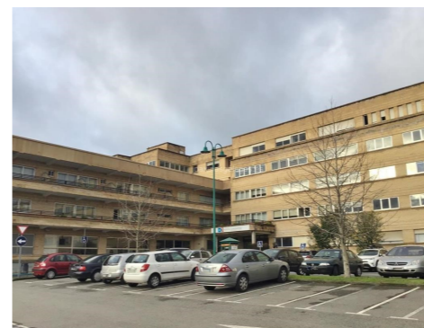
HOSPITAL RIVERA «JUAN CARDONA» FERROL