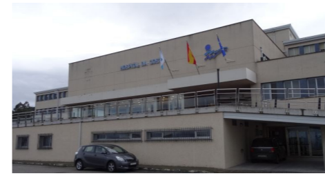
HOSPITAL PÚBLICO DA MARIÑA BURELA