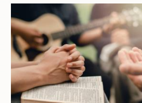
Momento 2 Oración desde o Evanxeo