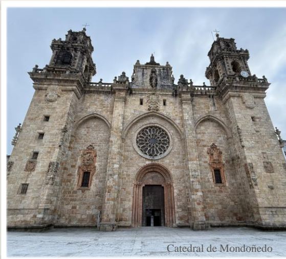
Catedral de Mondoñedo

A nosa Igrexa de Mondoñedo-Ferrol en canto igrexa particular comparte coa Igrexa Universal a Misión que o Señor lle confiou: