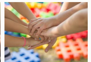
Momentos 3 e 4 Discernimento e compromiso