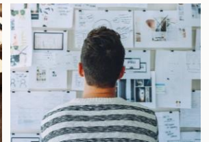
Momento 1 Desafío e diálogo