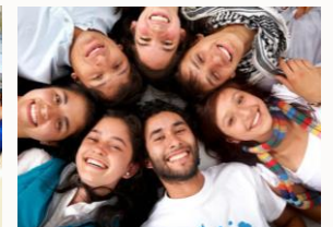
Destinatarios: leigos, relixiosos e sacerdotes