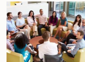
Obxectivo: Acadar un espazo de formación para os adultos

Trátase de que en cada Unidade Pastoral ou parroquia haxa un espazo para a formación cristiá dos adultos, de xeito que poidan compartir a súa vida e maila súa fe e dar así razón da súa esperanza. Terá que ser un lugar para o encontro e o diálogo, donde se poida compartir a oración desde a experiencia da vida de xeito que todos nos sintamos chamados a construír cada día o Reino de Deus no medio do mundo.