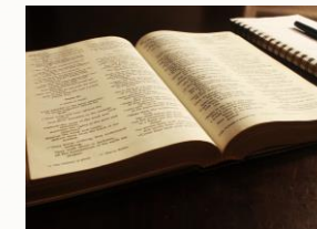
O Evanxeo de Xesús debe guiarnos sempre

Os destinatarios somos tódolos que formamos a nosa Igrexa de Mondoñedo-Ferrol: leigos, relixiosos e sacerdotes. Todos somos chamados para ser discípulos misioneiros e, polo tanto, todos podemos participar aportando o que é específico de cada vocación e contribuíndo a espallar o Evanxeo, que é a vocación da Igrexa enteira e de cada cristián.